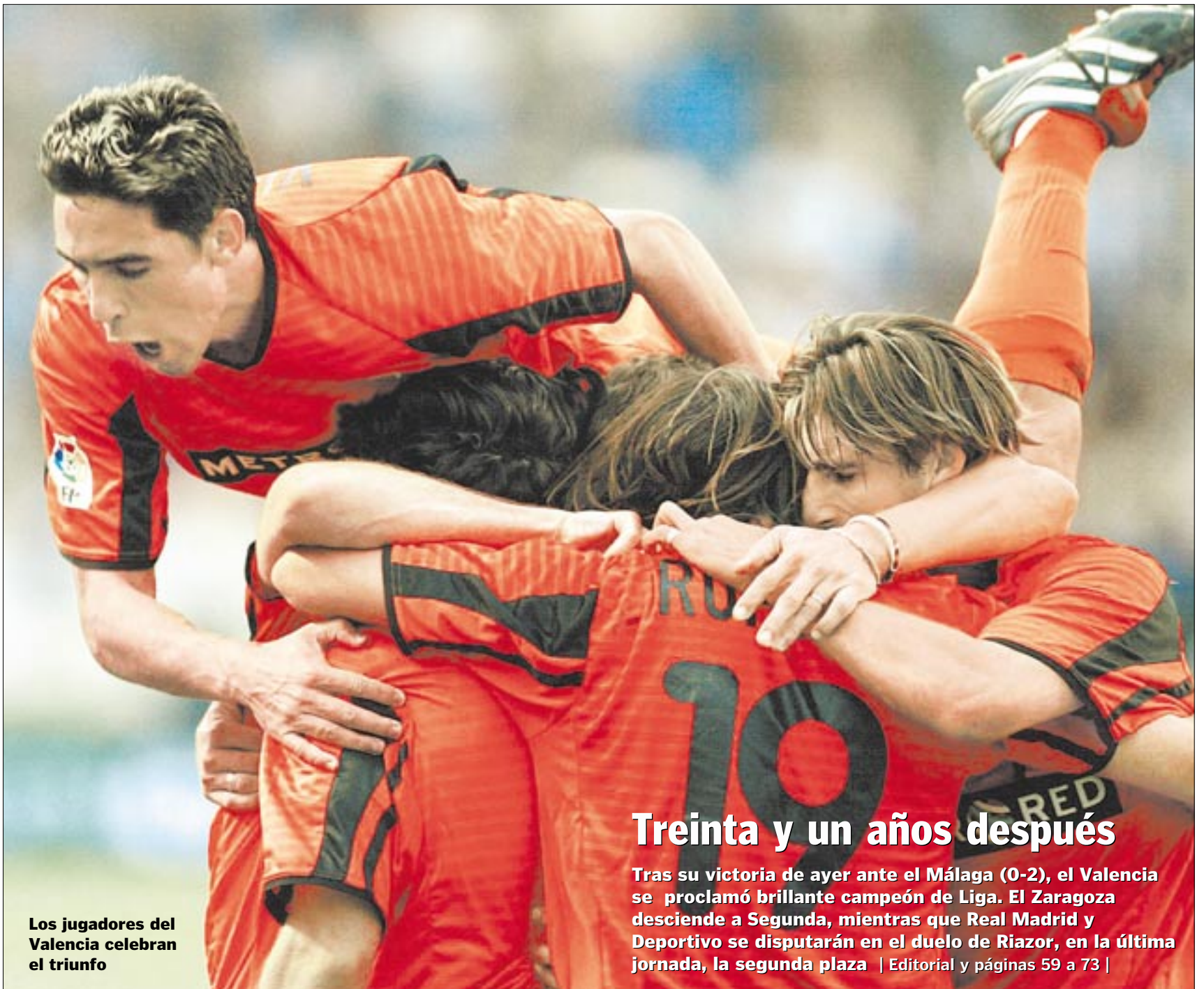
Los jugadores del Valencia celebran el triunfo

● Pese a su derrota, el «ultra» logró casi seis millones de votos | Editorial y 27-34 |