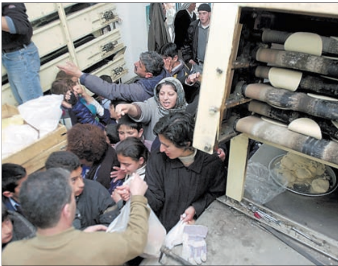
Grupos de palestinos se aprovisionan de pan en la ciudad de Ramala el jueves ante el temor a un ataque de Israel.

La Liga Árabe se opuso asimismo a un eventual ataque de Estados Unidos contra Irak, un país que la Administración estadounidense considera incluido en el llamado eje del mal . Washington mostró el jueves su apoyo al plan saudí y su escepticismo sobre la reconciliación de Irak y Kuwait. Páginas 2 a 4 Editorial en la página 8