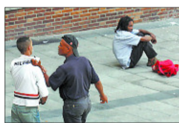
Una de las imágenes de violencia difundidas por vecinos de Desengaño.

Zapatero afirma que el diálogo con la organización terrorista comenzará este mes Página 25