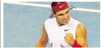
Tenis ABIERTO DE ESTADOS UNIDOS