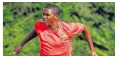
Barcelona SE PRESENTÓ TARDE