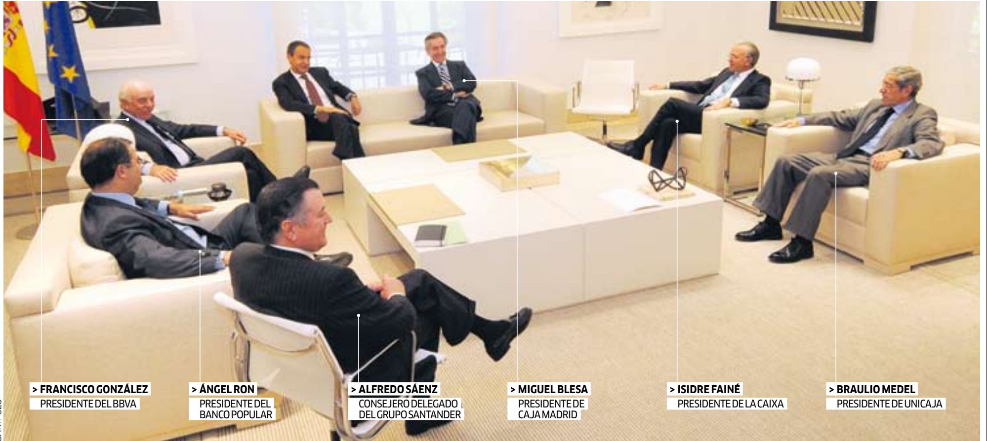
> FRANCISCO GONZÁLEZ PRESIDENTE DEL BBVA